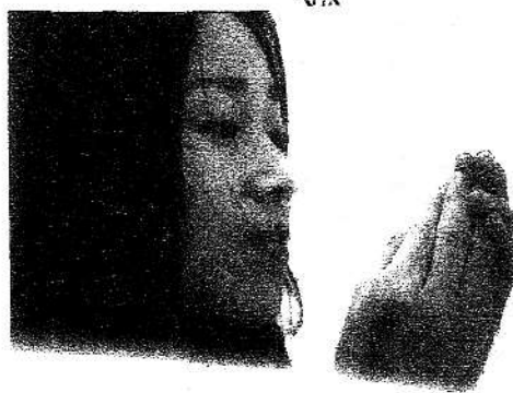
椿座による言葉語り